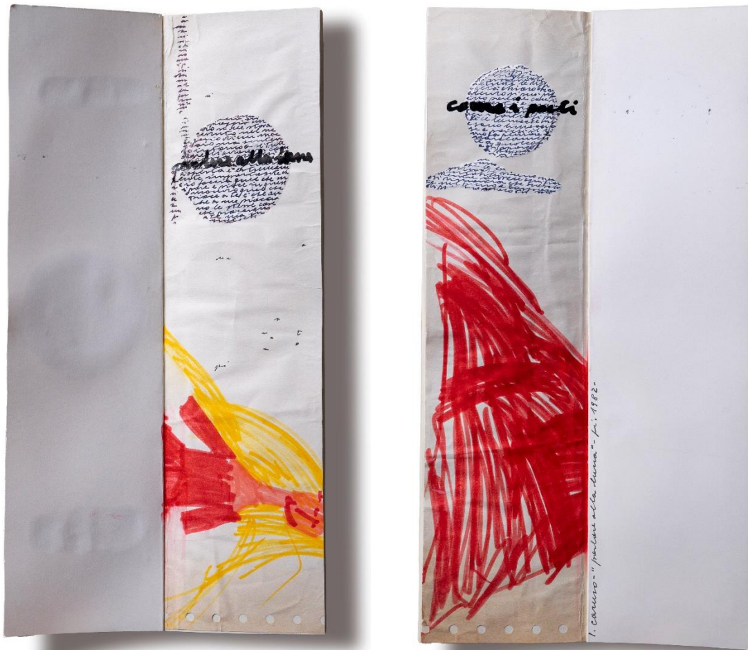
Figg. 1-2: Pagine interne di Parlare alla luna , 1982, pp. 24, chiuso 29x9x1,6 cm, libro-opera, collage, tempera, inchiostro nero di china, pennarelli colorati, scrittura su carta. Firenze, Archivio Luciano Caruso, Fondo libri in copia unica, inv. 119.